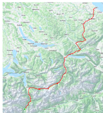
3. Etappe Wassen-Arbon 1