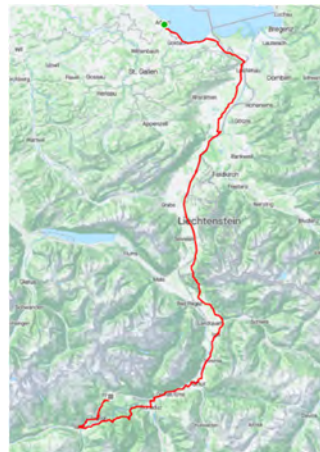
1. Etappe Arbon-Flims 1