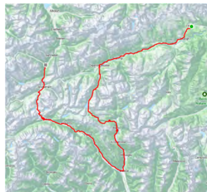
2. Etappe Flims-Wassen 1